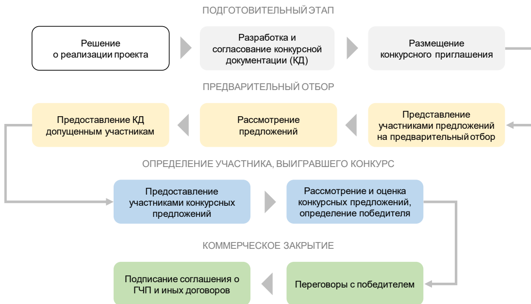
Рисунок 3. Процедура конкурса по отбору частного партнера для заключения соглашения о ГЧП в Республике Беларусь