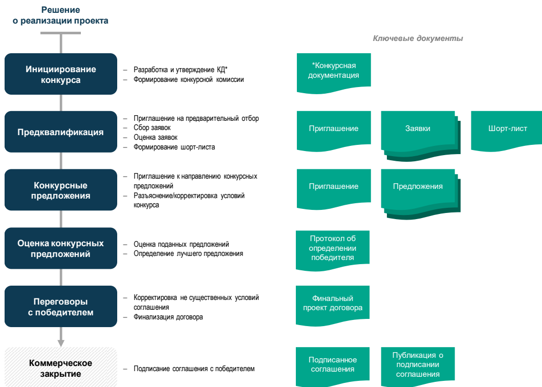
Рисунок 1. Типовая конкурсная процедура