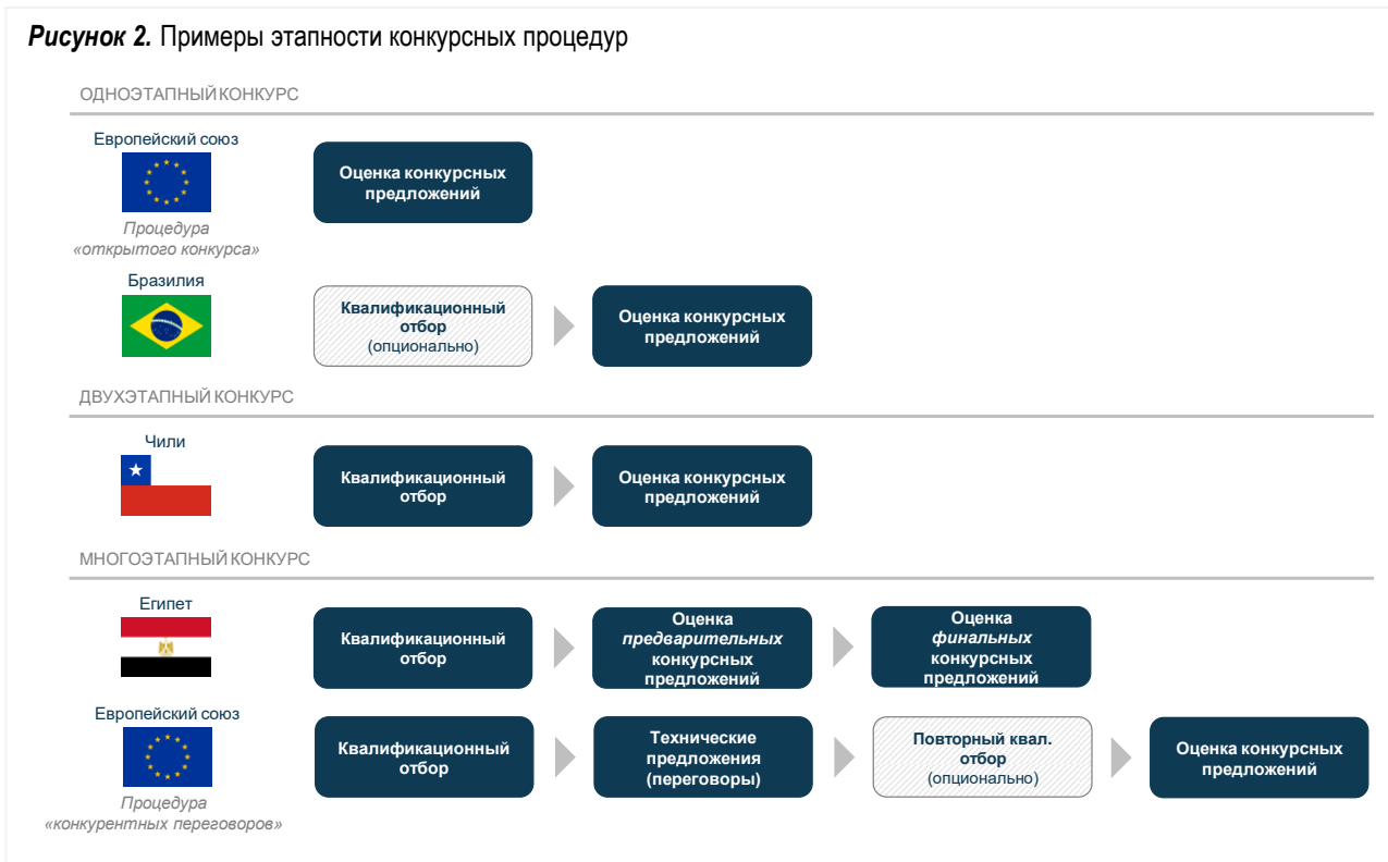
Рисунок 2. Примеры этапности конкурсных процедур