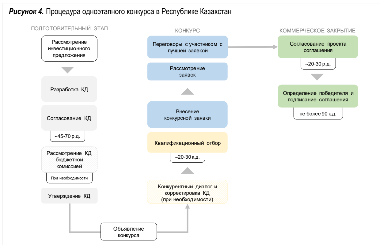
Рисунок 4. Процедура одноэтапного конкурса в Республике Казахстан