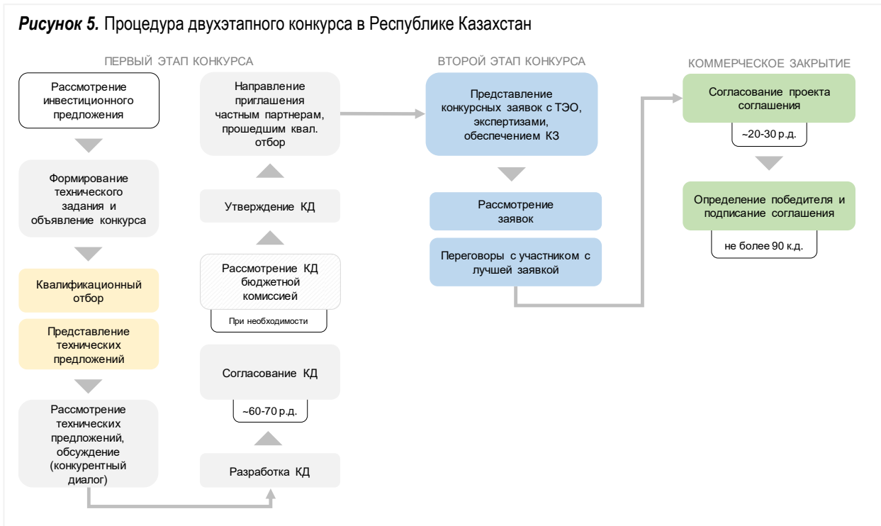
Рисунок 5. Процедура двухэтапного конкурса в Республике Казахстан