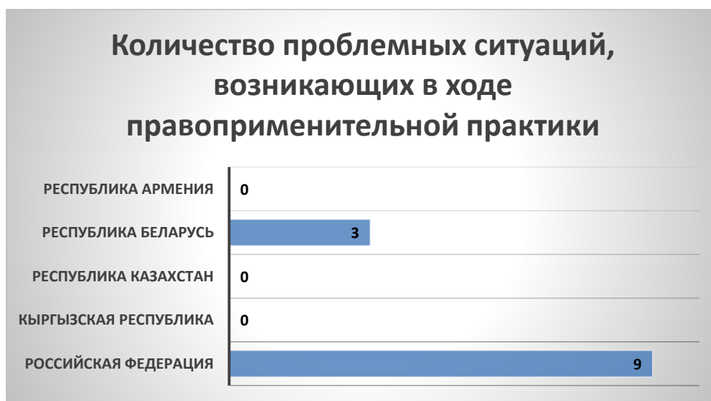
Рис. 2. Количество проблемных ситуаций, возникающих в ходе правоприменительной практики

Совокупное количество проблемных ситуаций, озвученных участниками ВЭД, составило 12 шт.