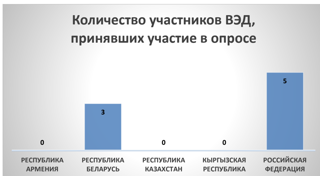
Рис. 1. Количество участников ВЭД, принявших участие в опросе.

Совокупное количество проблемных ситуаций, озвученных участниками ВЭД, составило 12 шт.