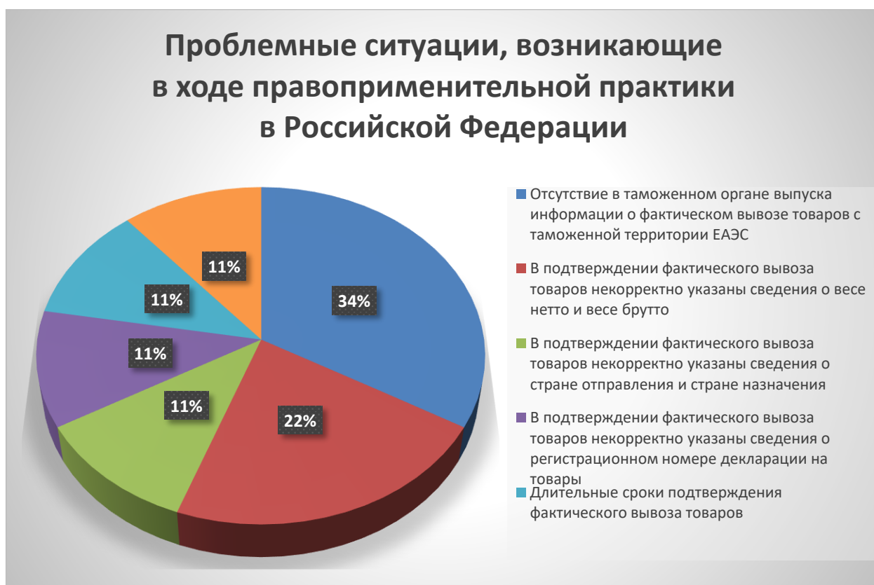
Рис. 4. Проблемные ситуации, возникающие в ходе правоприменительной практики в Российской Федерации