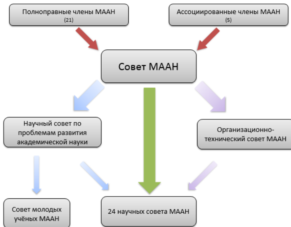
Рисунок 2. Организационно-функциональная схема МААН

По состоянию на октябрь 2021 года в состав МААН входят 21 полноправный и 6 ассоциированных членов, а также действуют 24 научных совета (Рисунок 2).