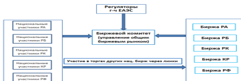
Рис. 3 Схема осуществления торгов на общем биржевом рынке товаров ЕАЭС (предложение РФ)

Основные принципы формирования общего биржевого рынка товаров в рамках Союза.